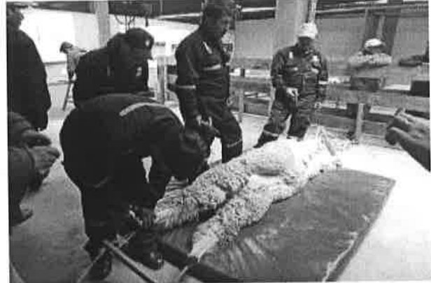
Validación de la NTP – técnicos nacionales