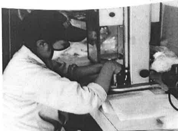
Guía Aplicativa – Mesa Internacional Laboratorios