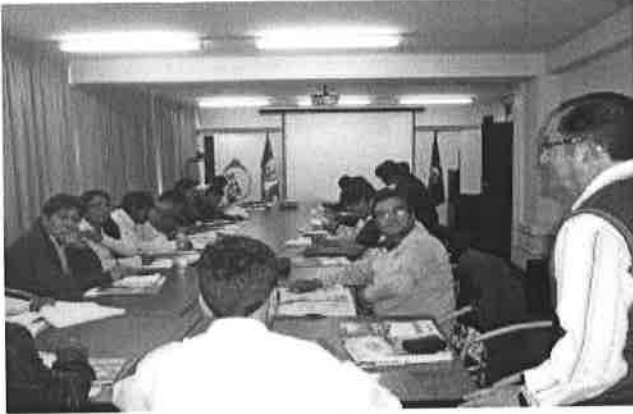
Reuniones de actualización de la NTP 231.370