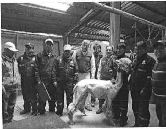
Validación Internacional de la NTP 231.370