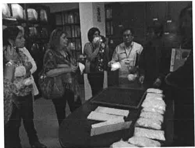
Mesa Técnica Laboratorios ISO 17025