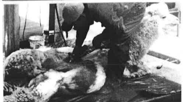
Manual de la NTP 231.370 - 2014